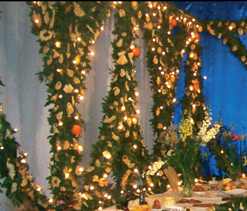
Autel de Saint Joseph

cucciddati , de grosses couronnes. Aux Vierges autrefois trois pauvres, identifiants la Sainte Famille, on offrait, devant l'autel votif, un déjeuner aux nombreux mets pour remercier de la grâce reçue suite à une guérison, au bon auspice lié au travail ou pour la bonne productivité de l'année.